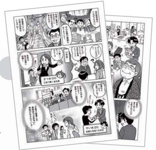
「輝け!江坂星~にぎわう街をつくらう~」より

精神や発達に障害のある実習生や大学生のインターンシップ生が地域を調査し、 集めた情報(最初は2,000社)を発信し、 地域経済の活性化を願ってサイトを運営してきました。